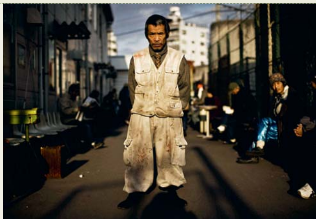
PRÉCAIRES. Dépourvus d'une vraie protection sociale, ces travailleurs sont particulièrement touchés.

Les chiffres dévoilés le 1 er août par le ministère japonais des Affaires sociales révèlent que, en 2012, 16,1% de la population vivaient sous le seuil de pauvreté. Celui-ci était alors estimé à 1,22 million de yens (8 629 euros), soit la moitié du revenu annuel médian. Pour la première fois, la part des enfants touchés par la pauvreté (16,3%) dépassait celle des adultes. Ce niveau confirme la place occupée par l'archipel depuis plusieurs années parmi les mauvais élèves de l'OCDE. Le Japon se situe en quatrième position des nations affichant le taux de pauvreté le plus élevé, derrière le Mexique, la Turquie et les Etats-Unis. Parmi les foyers à parent unique, il est en tête, à 58,7%, devant les Etats-Unis (50%). En France, à titre de comparaison, 19% de ces ménages vivent sous le seuil de pauvreté. L'Institut pour la population et la sécurité sociale (IPSS) , organisme public, souligne trois spécificités japonaises. L'importance des travailleurs pau-